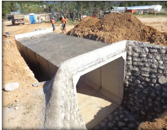
Mampostería de paso predial, Km 16,525.