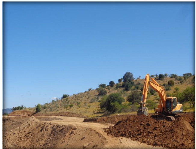
Corte de canal, Km 35,280.