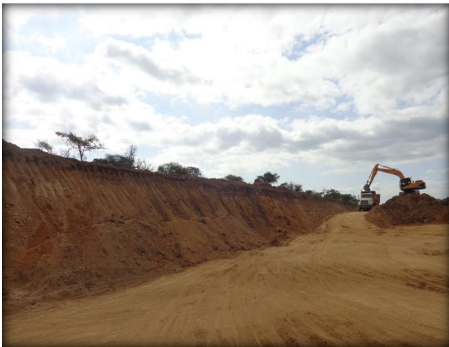
Corte en terreno, Km 21,020.