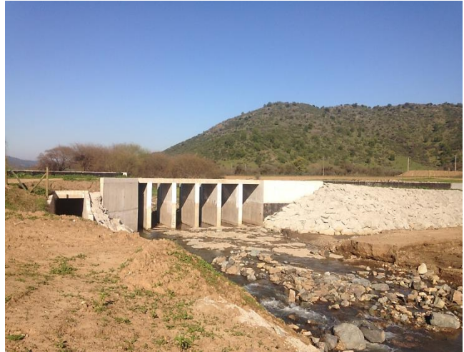
Bocatoma Canal Norte Unificado, barrera frontal.