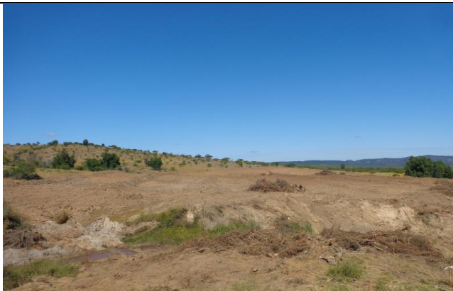
Escarpe, Km 20,400.