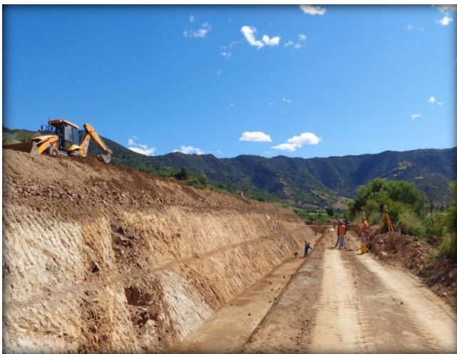
Corte de canal, Km 0,100.