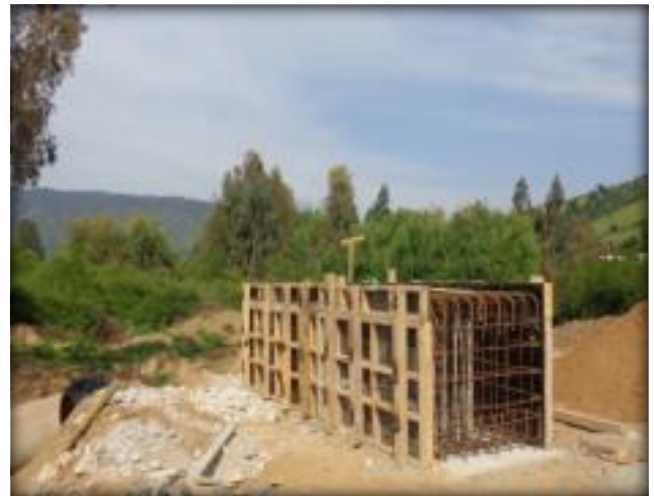
Moldaje para hormigonado de dado, cepa N°2.