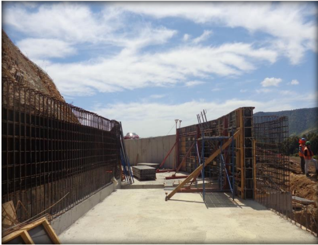
Armadura muro norte entrada sifón, Km 12,280.