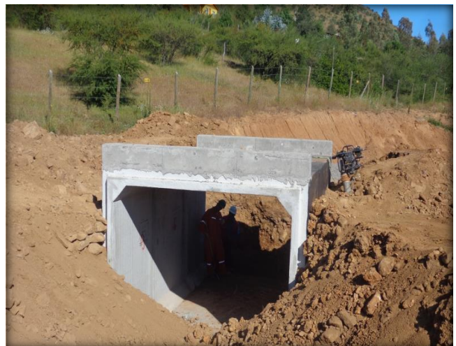
Instalación de cajón para paso predial, Km 16,390