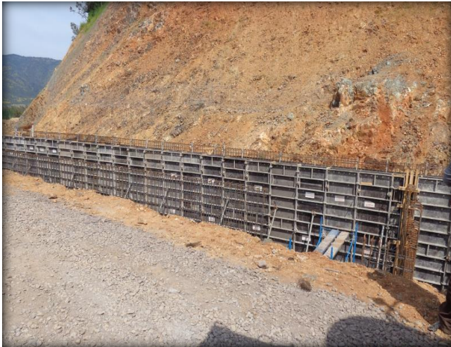
Moldajes en muro de canal de desagüe, entrada a sifón, Km 12,260.