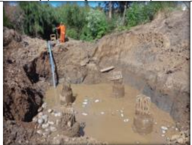
Pilotes, estribo de entrada.