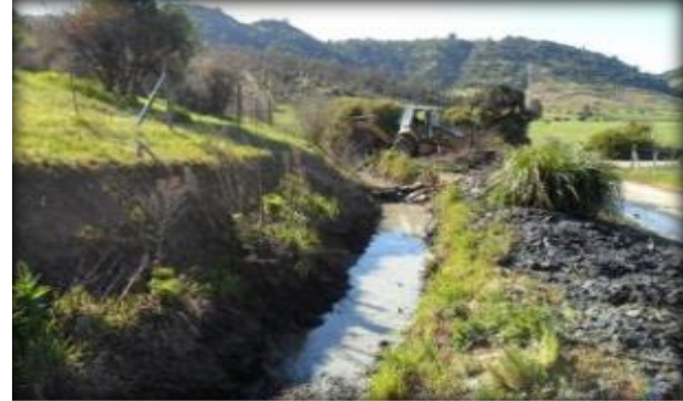
Sector de Canal Panamá Primario.

A partir del Canal Primario, se deriva el Canal Panamá Secundario, que se construirá en esta etapa, con un caudal de diseño establecido en el proyecto de la red primaria de 998 l/s, previsto para regar una superficie de 998 ha, con una longitud de 5.982 m. Será excavado en tierra sin revestimiento.