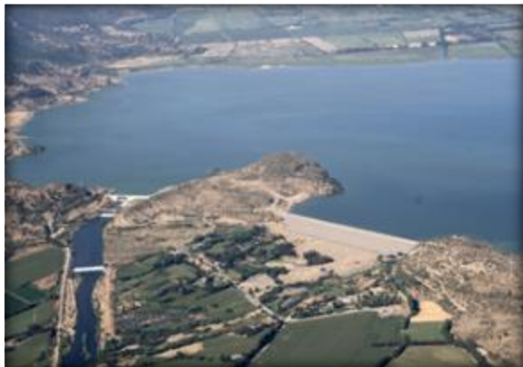
Zona de Presa y Embalse Convento Viejo.