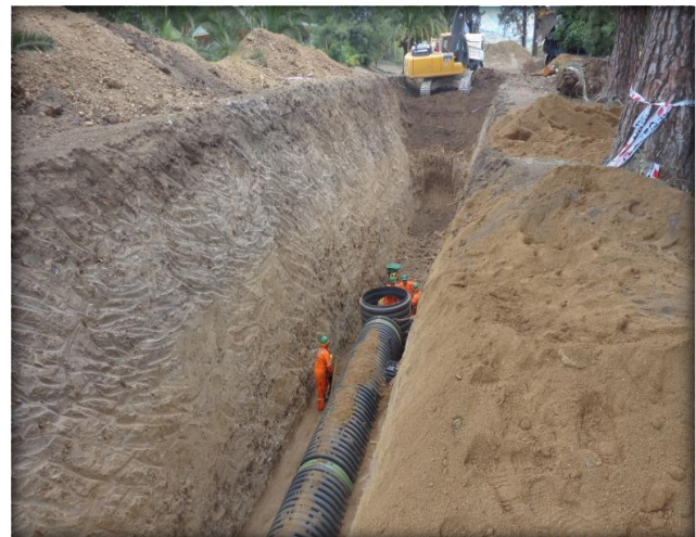
Colocación de cámara de inspección.