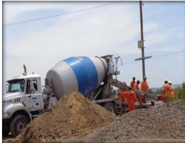
Hormigonado de cámara de Bogaris.