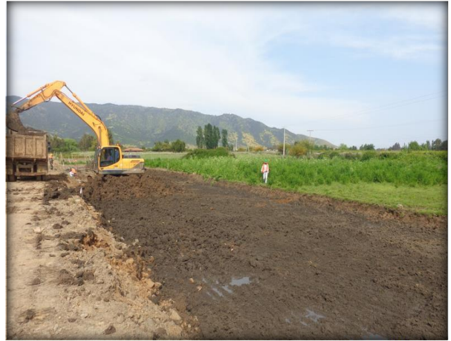
Escarpe para corte en terreno, Km 1,000.