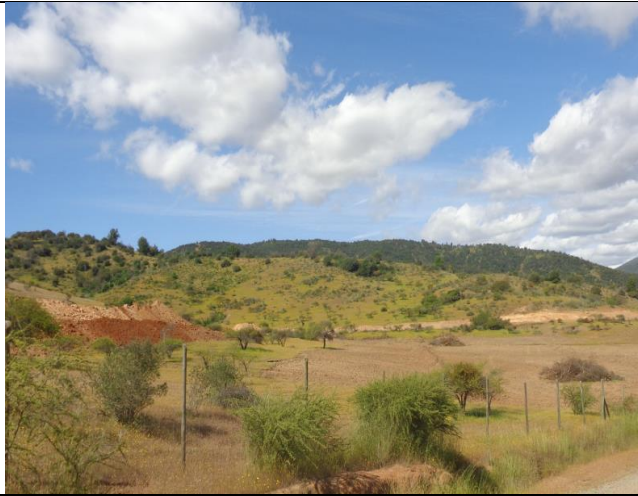
Escarpe, Km 22,300.