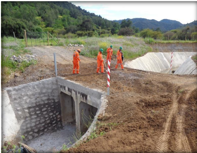
Mampostería y delineadores entrada y salida, paso predial Km 0,600.