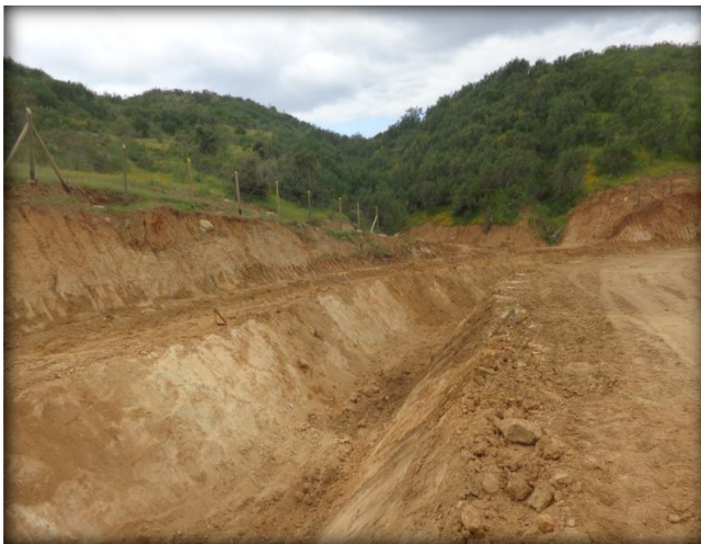
Corte de canal, Km 31,000.