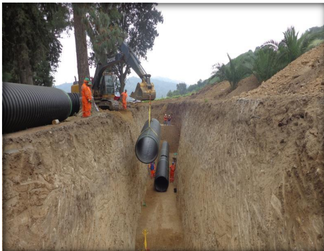
Instalación de tubos de HDPE, Km 1,800.