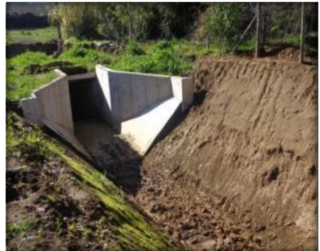
Cámara de salida de Sifón Fortaleza.

Esta obra permite dar continuidad al Canal Lolol Sur y se ubica entre el Km 0.850 y el km 0.925 de éste. Se proyecta en 75 m de largo y en un diámetro de 1,85 m en acero, para cruzar el Estero Fortaleza.