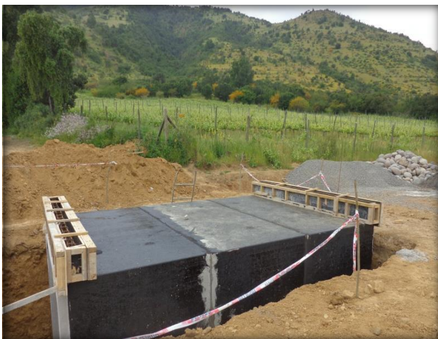
Paso predial, Km 16,080.