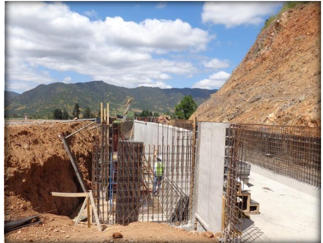
Armadura para muro de desagüe, Km 12,200.