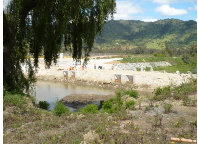
Vista panorámica Bocatoma Canal Lolol Sur.

Los recursos de este canal permitirán regar los sectores de Pastizales, Lolol Bajo, El Peumo, La Palma, Monterina Baja, Tres Esquinas, Vaticano, Portezuelo y El Guaiquillo.