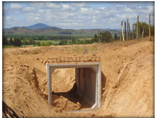
Instalación de paso predial, Km 30,780.