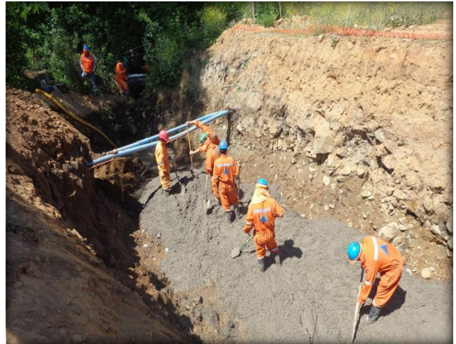
Emplantillado de cruce de quebrada CQ6, Km 4,940.