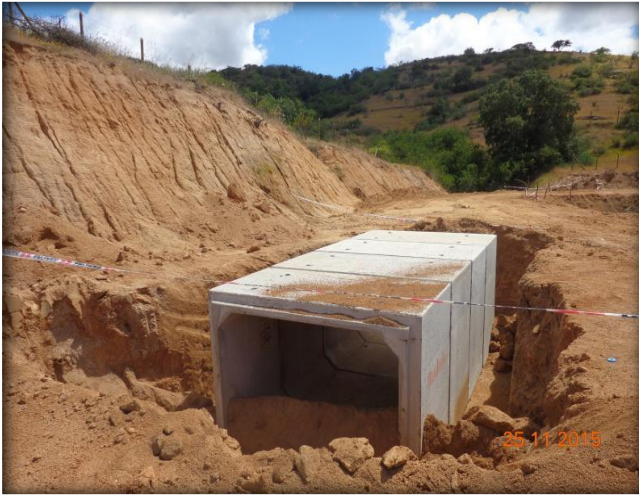
Instalación de paso predial, Km 31,140.