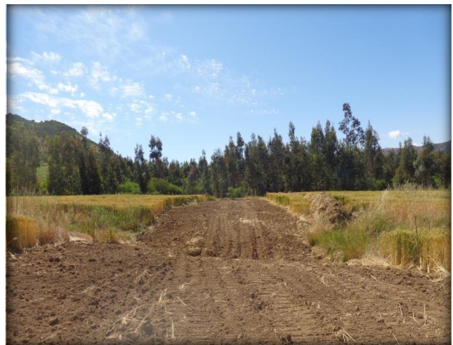
Escarpe, Km 2,100.