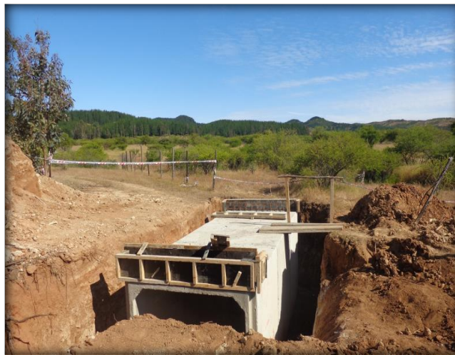
Paso predial, Km 42,740.