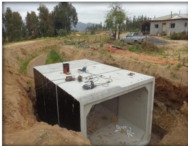
Paso predial, Km 29,920.