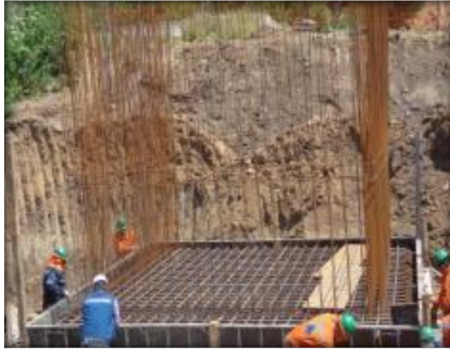
Enfierradura, estribo de entrada.