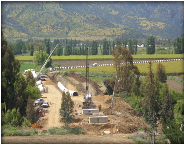
Vista panorámica Sifón Nerquiue.