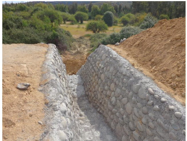
Mampostería de vertedero.