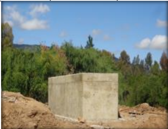
Dado, cepa N°2.