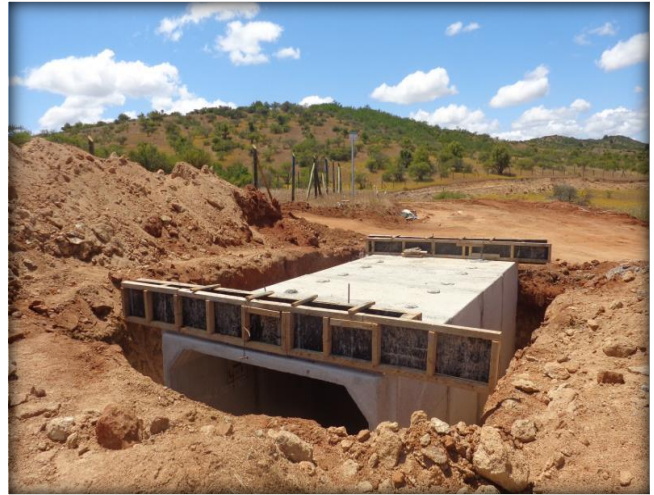
Paso predial, muros guarda ruedas, Km 39,520.